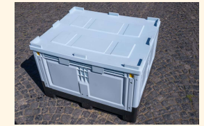
Rundum-sorglos-Paket - Heubox + Gitter + Deckel