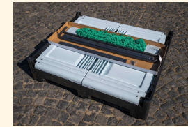
Heubox mit Netz & Gitter