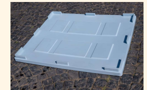
Deckel zum Nachrüsten